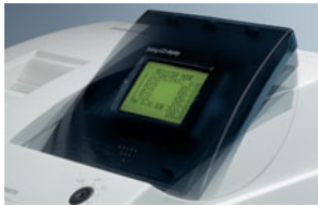
Das LCD-Display, schwenkbar