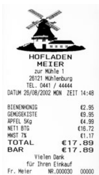
← grafisches Logo