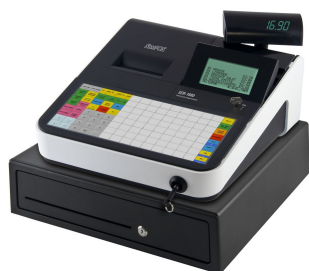
Abbildung zeigt die ECR-1880 mit der Sonderausstattung Kellnerschloss

Die Tastatur, die Wahlweise als Flach- oder als Hubtastatur erhältlich, ist frei programmierbar. So lässt sich das System auf Ihre Anforderungen einrichten. Nützliche Funktionen wie z.B. Menüfenster vereinfachen die Bedienung und verkürzen Einweisungszeiten. Leistungsrahmen